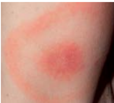
Érythème chronique migrant

À un stade précoce, de la fièvre, des céphalées et de la fatigue peuvent également survenir.